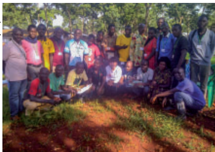
A tady je celý tým, jenž v terénu pomáhá uprchlíkům překonat jejich problémy