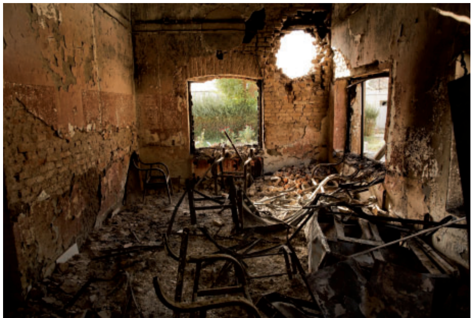
Pohled na jednu z místností traumacentra Lékařů bez hranic v Kundúzu po bombardování. Ve zdi zůstala díra po raketě

tři nemocnice byly řádně označené. Celkem bylo zasažených nemocnic v Jemenu o mnoho více – zhruba 130.