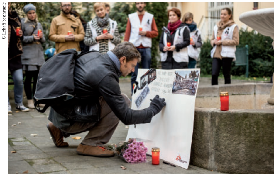
Oběti bombardování traumacentra v Kundúzu uctili spolupracovníci Lékařů bez hranic na celém světě, včetně české kanceláře organizace

Válčící strany musí učinit vše, aby se ujistily, že útočí na vojenský a nikoliv na civilní cíl (včetně nemocnic). Pokud mají jakékoliv pochybnosti, měly by automaticky předpokládat, že jde o civilní objekt a od útoku musí tudíž upustit. Nesmějí zasáhnout neznámou budovu.