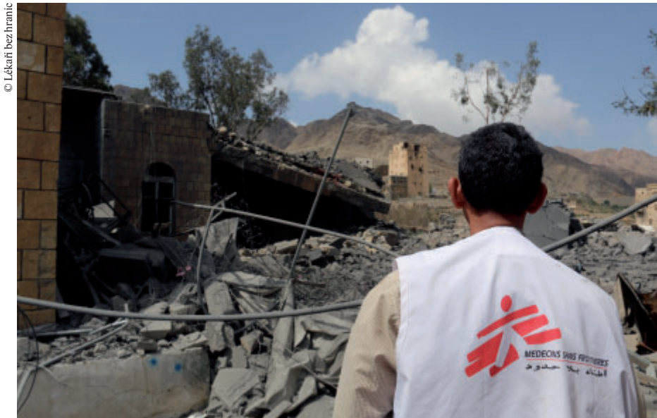
Nemocnice v jemenském městě Haydan byla zničena při náletech v říjnu loňského roku

Letecké bombardování, při němž zemřely skoro tři desítky lidí, vykazovalo známky cíleného útoku. Konkrétně takzvaného „double tap“ útoku, jenž spočívá v tom, že objekt je zasažen v několika vlnách – po prvním útoku přichází v rozmezí 20 až 60 minut druhý a ten cílí na záchranáře, kteří přispěchali na pomoc raněným z prvního bombardování. V případě nemocnice Ma'arat an-Numán následoval o něco později ještě třetí útok na další zdravotnické zařízení, které přijalo raněné ze zničené nemocnice. Případ to nebyl ojedinělý.