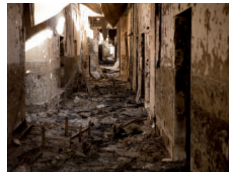
Traumacentrum Lékařů bez hranic v Kundúzu před bombardováním a po něm