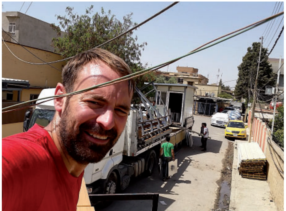
Selfie při stěhování karavanu, já sedím na korbě dalšího nákladního auta