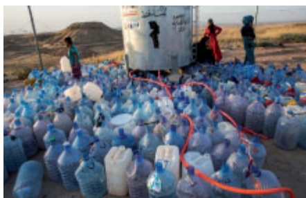
Zajistit uprchlíkům dodávky pitné vody je jedním z úkolů logistika