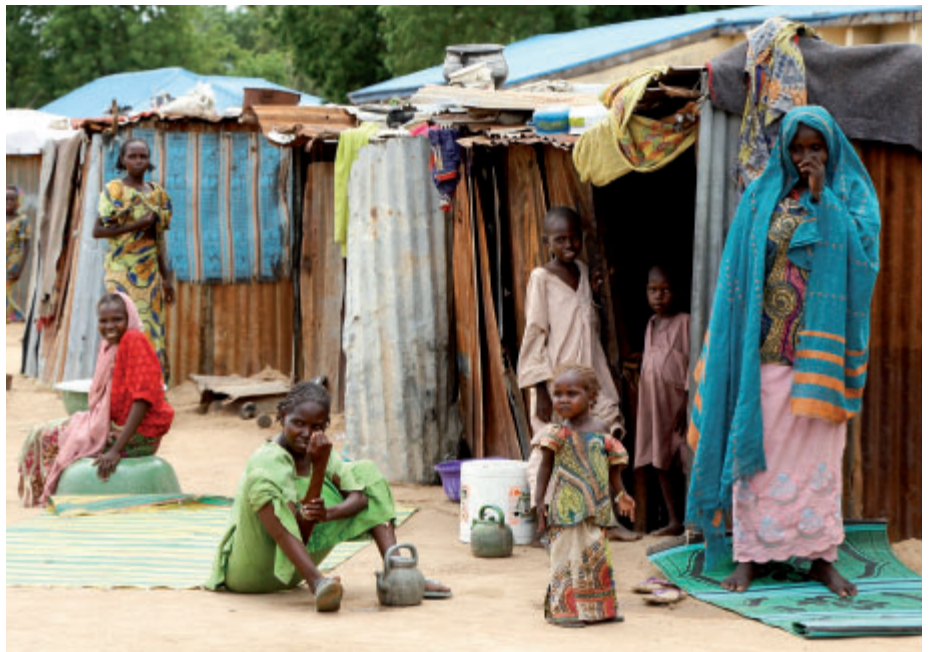
Tábor pro vnitřně vysídlené lidi ve městě Bama