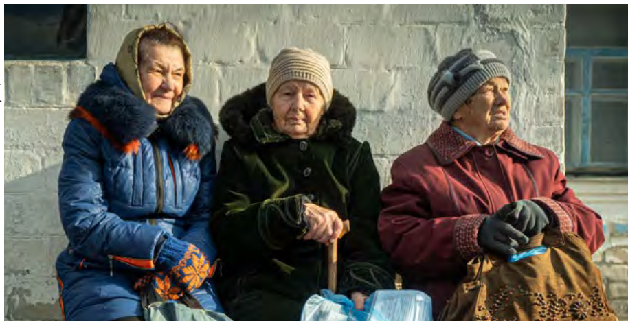
☞ Seniori čekají na léky před improvizovanou ordinací Lékařů bez hranic ve vesnici Vodjane. Kvůli konfliktu je zásobování obcí v blízkosti frontové linie minimální.

ostřelování, ona sama se v roce 2014 ocitla blízko bojů.